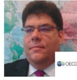
السيد أندرو ريلي، كبير محلي سياسات التأمين الاجتماعي، منظمة التعاون الاقتصادي والتنمية