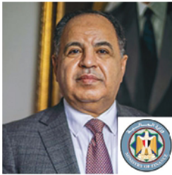
H.E. Dr. Mohamed Maait, Minister of Finance, Egypt

Opening address by Ministers and high-ranking officials attending the conference.