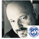
مدير الجلسة : السيد جابا فيهر، مستشار إقتصادي أول، صندوق النقد الدولي