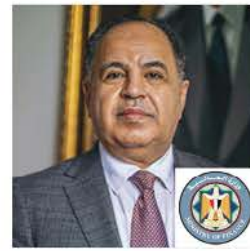
معالي الدكتور محمد أحمد معيط، وزير المالية، مصر