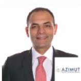
السيد أحمد أبو السعود، الرئيس التنفيذي، أزيমوت مصر لإدارة الصناديق ومحافظ الأوراق المالية، مصر