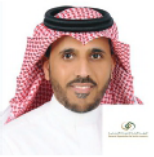
السيد عاصم الجريد، مدير إدارة حلول التسجيل والاشتراكات، المؤسسة العامة للتأمينات الاجتماعية، المملكة العربية السعودية

المهندس خالد العطار، نائب وزير الاتصالات وتكنولوجيا المعلومات للتنمية الإدارية والتحول الرقمي والميكنة، مصر