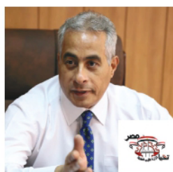
H.E. Hassan Mohamed Shehata, Minister of Manpower, Egypt