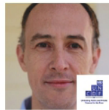
السيد ويليام برايس، كبير المستشارين، صندوق تنمية رأس المال التابع للأمم المتحدة، الأمم المتحدة