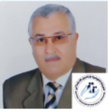
اللواء فهيم إدريس، مستشار الرئيس، الهيئة القومية للتأمين الاجتماعي للتحول الرقمي، مصر

كيف قامت مؤسسات التأمين الاجتماعي باختيار أنظمة تكنولوجيا المعلومات التي تستخدمها؟ هل تمكنوا من تطوير وتنفيذ أنظمتهم الداخلية؟ هل توجد صناعة برمجيات للتأمين الاجتماعي والإدخار التقاعدي في العالم العربي؟