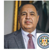
H.E. Dr. Mohamed Maait, Minister of Finance, Egypt