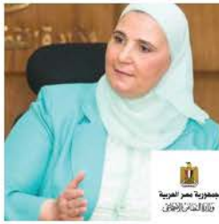
معالي الدكتورة نيفين القباج، وزيرة التضامن الاجتماعي، مصر

كلمات إفتتاحية يلقيها معالي الوزراء وكبار المسؤولين الذين يحضرون المؤتمر.