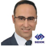
السيد أولوج إيكوز، نائب الرئيس، هيئة تنظيم ورقابة التأمين والتقاعد الخاص، تركيا