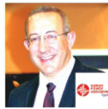
السيد عماد نصر، رئيس الإتحاد المصري للموارد البشرية (HRA)، عضو مجلس إدارة غرفة التجارة الأمريكية في مصر