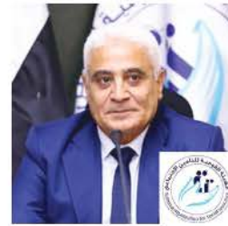
معالي اللواء جمال عوض، رئيس مجلس إدارة الهيئة القومية للتأمين الاجتماعي، مصر