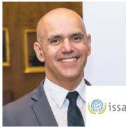
معالي السيد مارسيلو أبي راميا كابتانو، الأمين العام للجمعية الدولية للضمان الاجتماعي