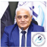
معالي اللواء جمال عوض، رئيس مجلس إدارة الهيئة القومية للتأمين الاجتماعي، مصر

إن الإجراءات السياسية، سواء في الخصخصة أو تنوع الموارد الاقتصادية وزيادة الإيرادات، لتحسين الاستدامة طويلة الأجل للمالية العامة مع ضمان كفاية المعاشات التقاعدية أمر بالغ الأهمية. ماذا يجب أن تكون الأولويات؟ وكيف ينبغي إشراك المعنيين والأطراف الفاعلة لانجاح هذه الإصلاحات؟