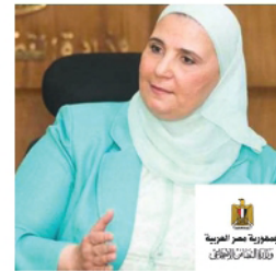
H.E. Dr. Nivine El-Kabbag, Minister of Social Solidarity, Egypt