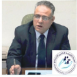
الاستاذ محمد سعودي، نائب رئيس الهيئة القومية للتأمين الاجتماعي، مصر