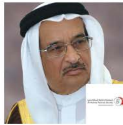
معالي الفريق طبيب الشيخ محمد بن عبدالله آل خليفة، رئيس المجلس الأعلى للصحة ورئيس جمعية الحكمة للمتقاعدين، البحرين