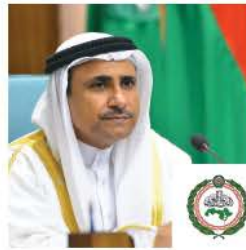
معالي السيد عادل العسومي، رئيس البرلمان العربي