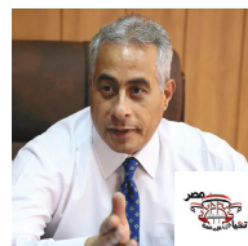
معالي الاستاذ حسن محمد شحاتة، وزير القوى العاملة، مصر